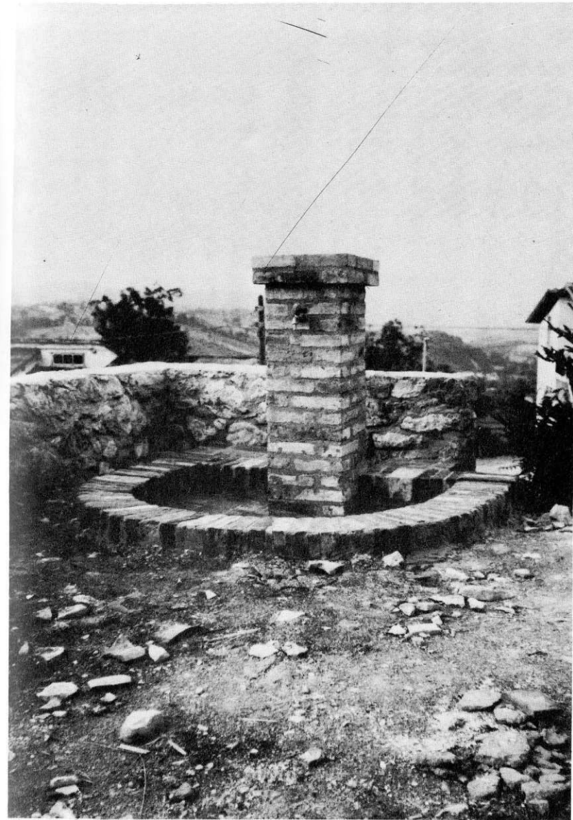
Colliberti - Fontanino posto nell'area antistante la Chiesa di S. Lorenzo