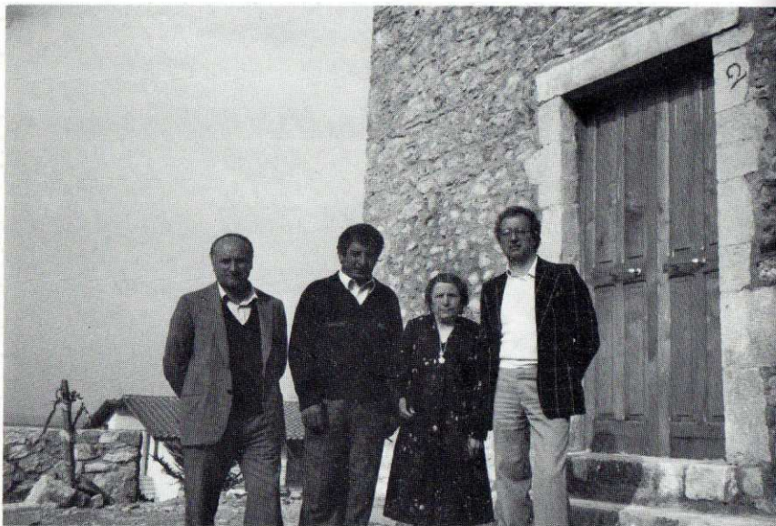
Colliberti - Comitato pro-ricostruzione della Chiesa di S. Lorenzo.

Alle ditte locali chiedemmo un qualsiasi oggetto dei loro negozi per organizzare una lotteria. La curarono i ragazzi di Colliberti e i proventi furono versati sul fondo costituito.