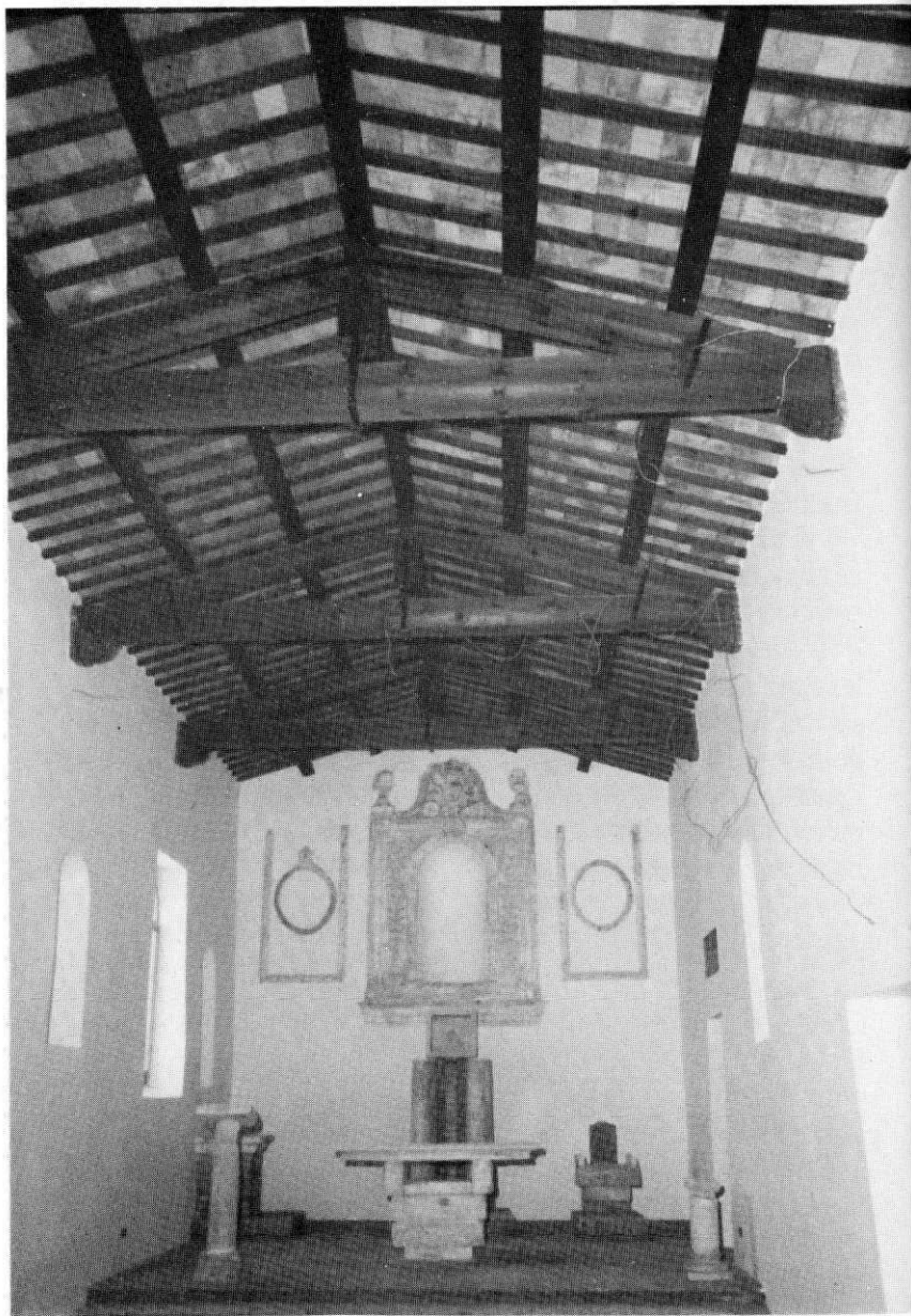
Colliberti - Chiesa di S. Lorenzo. La navata.